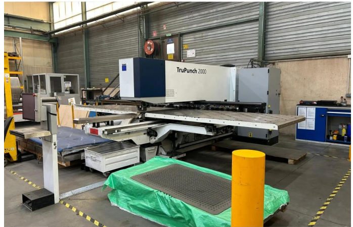
POINCONNEUSE TRUMPF Type TRU PUNCH 2000 (1).webp