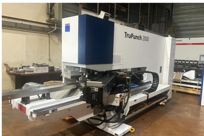
POINCONNUEUSE TRUMPF Type TRU PUNCH 2000 (4).webp