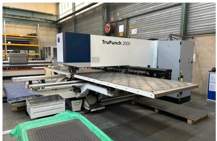
POINCONNEUSE TRUMPF Type TRU PUNCH 2000 (2).webp