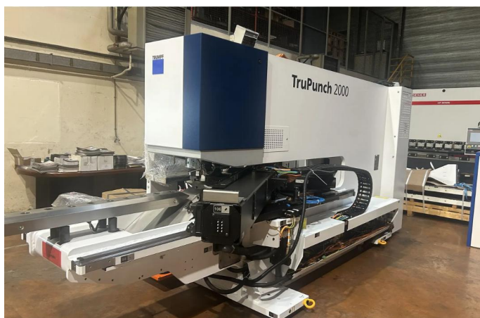
POINCONNEUSE TRUMPF Type TRU PUNCH 2000 (4).webp