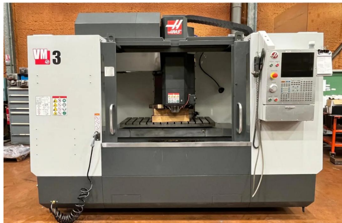
CENTRE D'USINAGE VERTICAL HAAS VM3 (1).webp