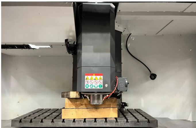
CENTRE D'USINAGE VERTICAL HAAS VM3 (2).webp