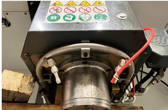
CENTRE D'USINAGE VERTICAL HAAS VM3 (3).webp