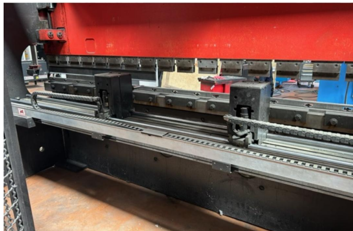
PRESSE PLIEUSE CNC AMADA HFBO 1254 (1).webp