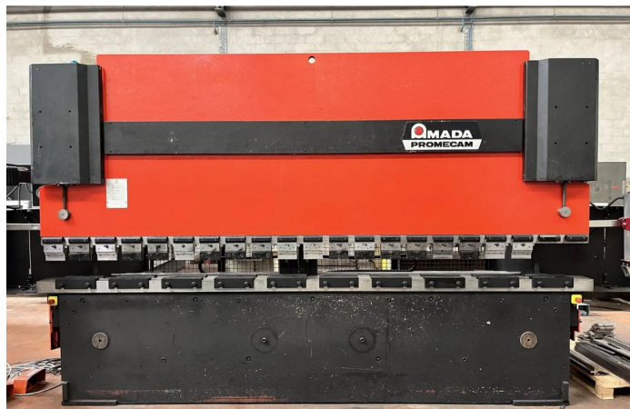
PRESSE PLIEUSE CNC AMADA HFBO 1254 (2).webp