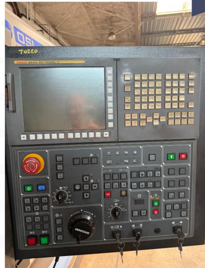
Tour DOOSAN type PUMA 480L d'occasion (2).webp