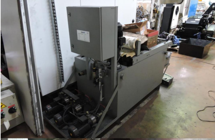
CENTRE D USINAGE VERTICAL DECKEL MAHO V64 LINEAR (2).webp