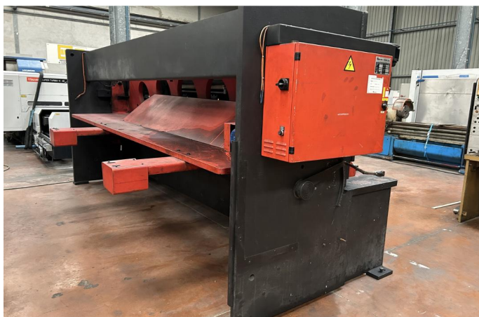
CISAILLE GUILLOTINE AMADA GPS 840 (3).webp