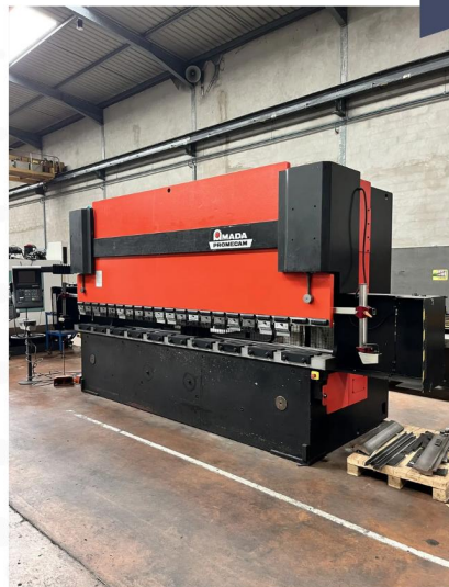
PRESSE PLIEUSE CNC AMADA HFBO 1254 (4).webp