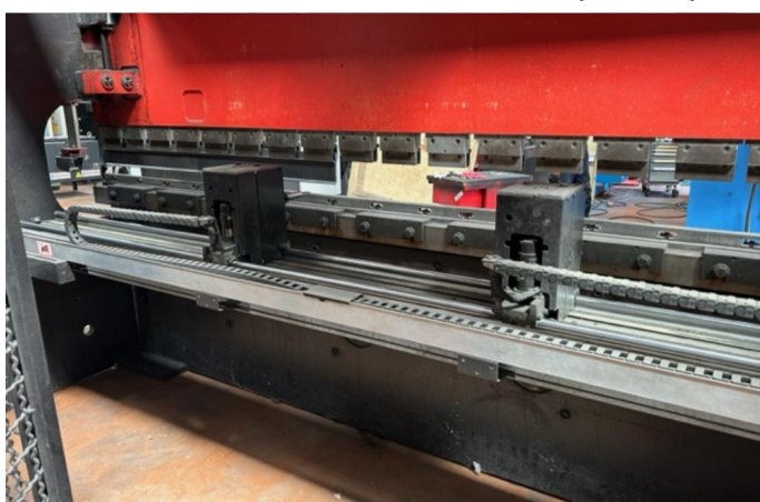
PRESSE PLIEUSE CNC AMADA HFBO 1254 (1).webp