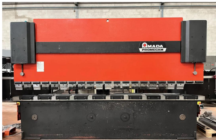
PRESSE PLIEUSE CNC AMADA HFBO 1254 (2).webp