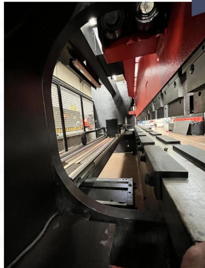
PRESSE PLIEUSE CNC AMADA HFBO 1254 (7).webp