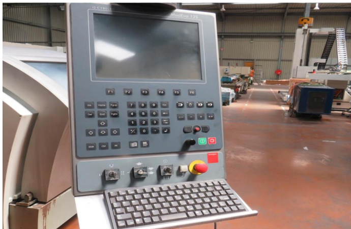
PRESSE PLIEUSE CNC BYSTRONIC PR 6020 (2).webp