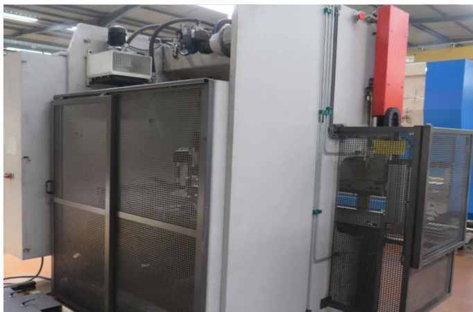
PRESSE PLIEUSE CNC BYSTRONIC PR 6020 (4).webp