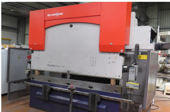
PRESSE PLIEUSE CNC BYSTRONIC PR 6020 (1).webp