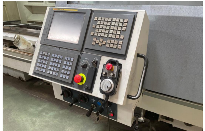
TOUR CNC COLCHESTER HARRISON ALPHA 2800 XS (10).webp