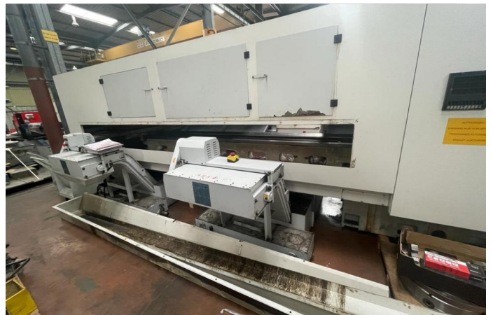
TOUR CNC COLCHESTER HARRISON ALPHA 2800 XS (8).webp