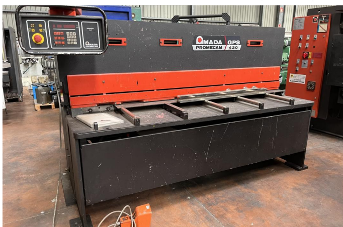
CISAILLE GUILLOTINE AMADA GPS 420 (1).webp