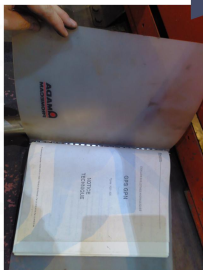
CISAILLE GUILLOTINE AMADA GPS 420 (4).webp