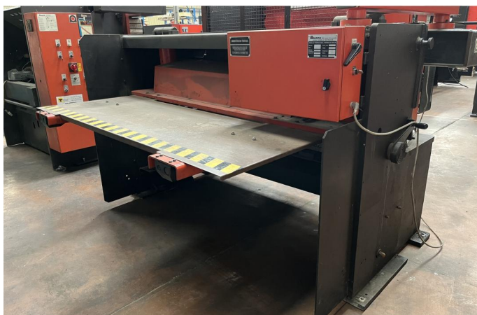
CISAILLE GUILLOTINE AMADA GPS 420 (2).webp