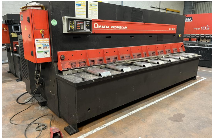
CISAILLE GUILLOTINE AMADA GX 840 GE (1).webp