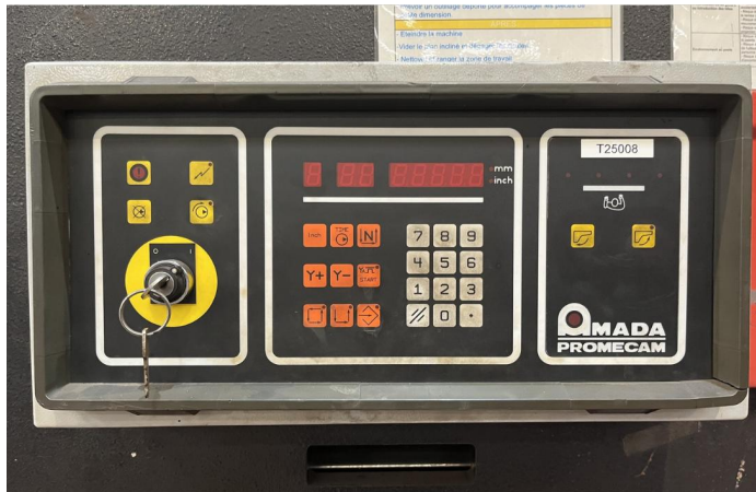
CISAILLE GUILLOTINE AMADA GX 840 GE (2).webp