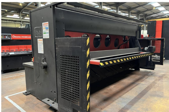
CISAILLE GUILLOTINE AMADA GX 840 GE (3).webp