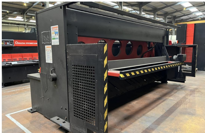
CISAILLE GUILLOTINE AMADA GX 840 GE (3).webp