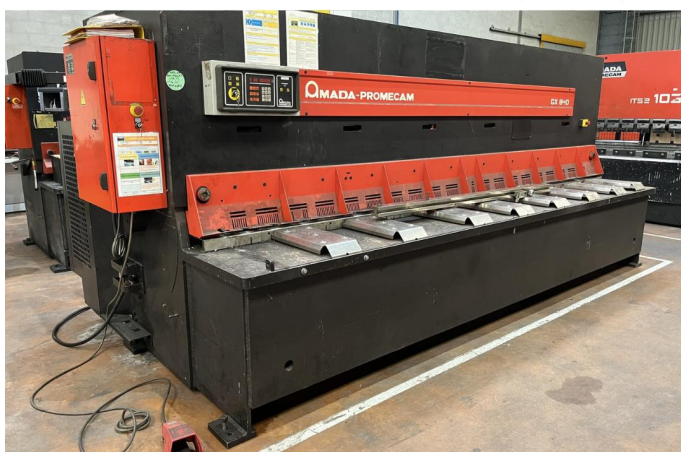
CISAILLE GUILLOTINE AMADA GX 840 GE (1).webp