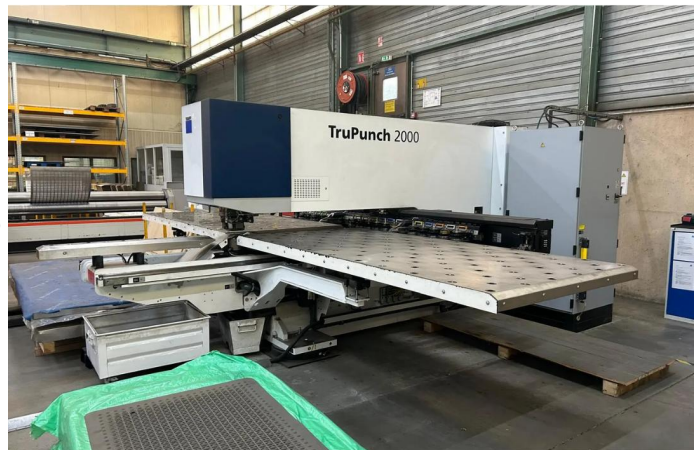
POINCONNEUSE TRUMPF Type TRU PUNCH 2000 (2).webp