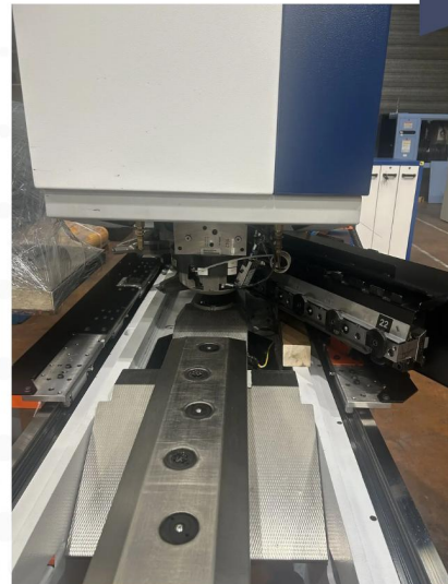
POINCONNEUSE TRUMPF Type TRU PUNCH 2000 (7).webp