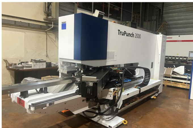
POINCONNEUSE TRUMPF Type TRU PUNCH 2000 (4).webp