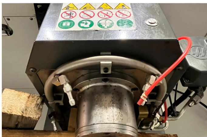
CENTRE D'USINAGE VERTICAL HAAS VM3 (3).webp