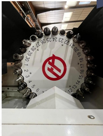
CENTRE D'USINAGE VERTICAL HAAS VM3 (8).webp