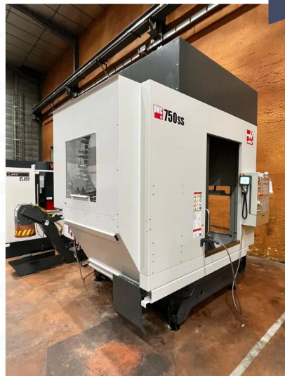
CENTRE D'USINAGE 5 axes HAAS UMC 750 SS (1).webp