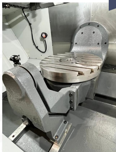
CENTRE D'USINAGE 5 axes HAAS UMC 750 SS (7).webp