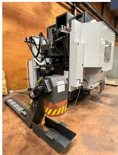
CENTRE D'USINAGE 5 axes HAAS UMC 750 SS (3).webp