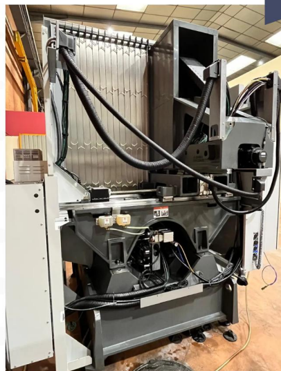
CENTRE D'USINAGE 5 axes HAAS UMC 750 SS (4).webp