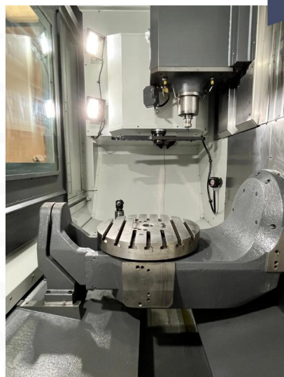
CENTRE D'USINAGE 5 axes HAAS UMC 750 SS (8).webp