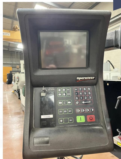
PRESSE PLIEUSE CNC AMADA HFBO 1254 (6).webp