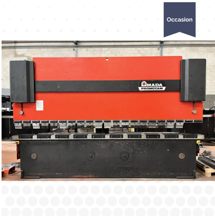
PRESSE PLIEUSE CNC AMADA HFBO 1254 (2).webp