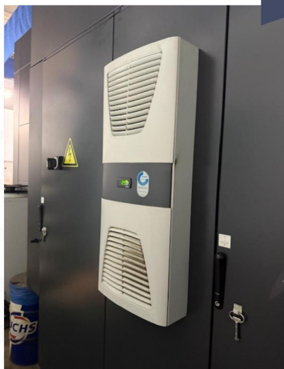
Centre d'usinage vertical 5 axes IBARMIA type ZHV603000 EXTREME d'occasion (1).webp