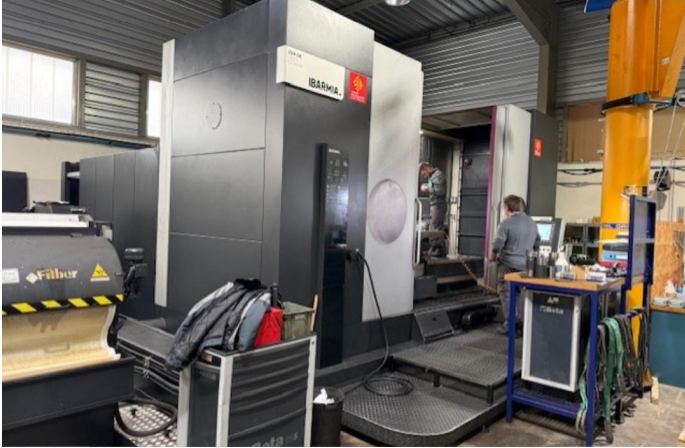
Centre d'usinage vertical 5 axes IBARMIA type ZHV603000 EXTREME d'occasion (6).webp