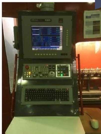
Centre d'usinage vertical 5 axes a portique - FPT - DINO (1).webp