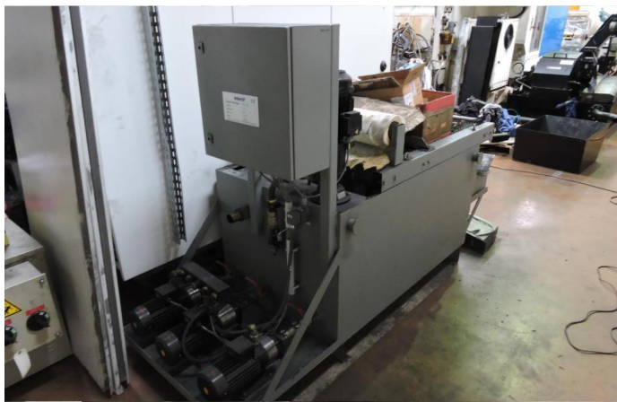
CENTRE D USINAGE VERTICAL DECKEL MAHO V64 LINEAR (2).webp