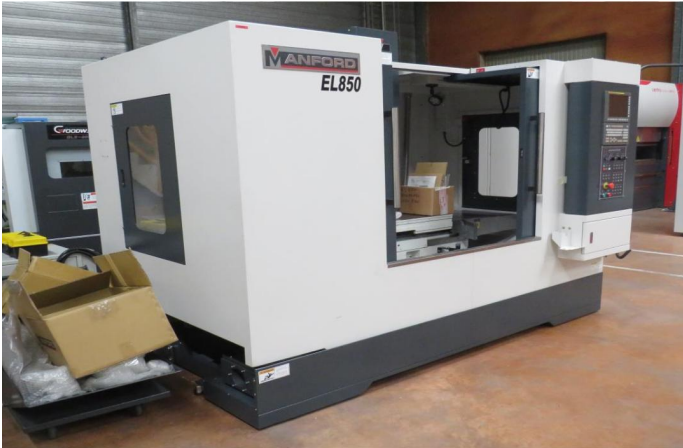
CENTRE D'USINAGE VERTICAL MANFORD EL 850 neuf en stock (2).webp