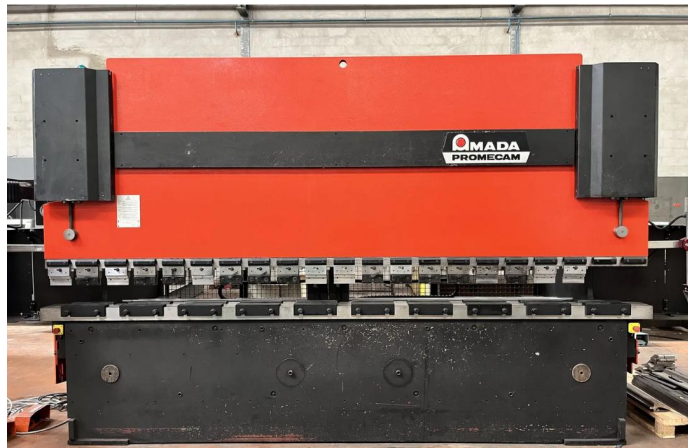
PRESSE PLIEUSE CNC AMADA HFBO 1254 (2).webp