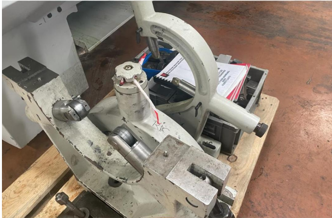
TOUR CNC RICHYOUNG RIC TC33120 (4).webp