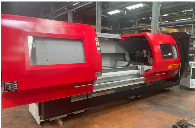
TOUR CNC RICHYOUNG RIC TC33120 (1).webp