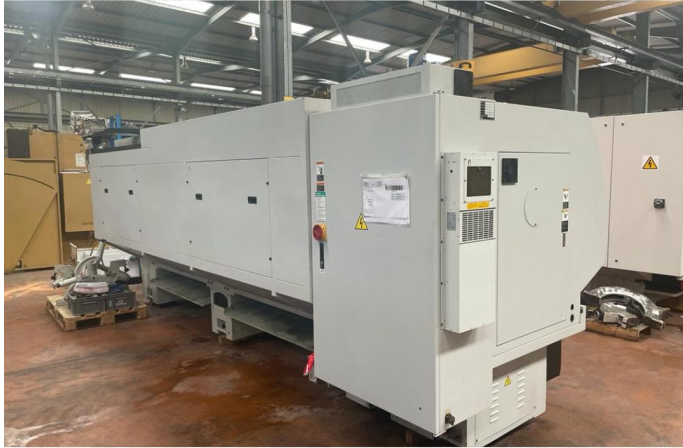
TOUR CNC RICHYOUNG RIC TC33120 (6).webp