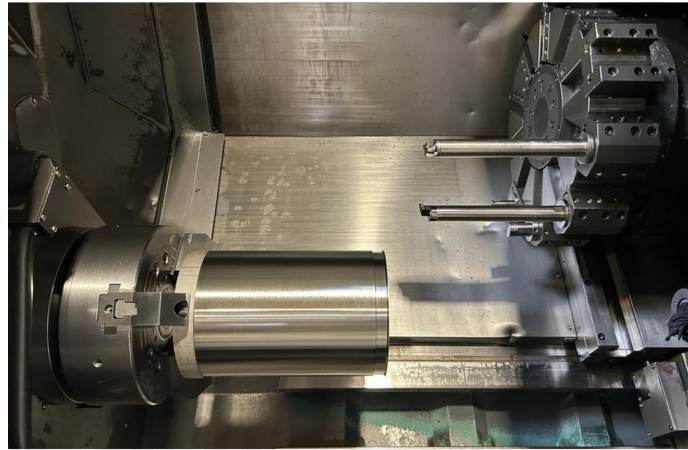
TOUR CNC DOOSAN TYPE 4100B (3).webp