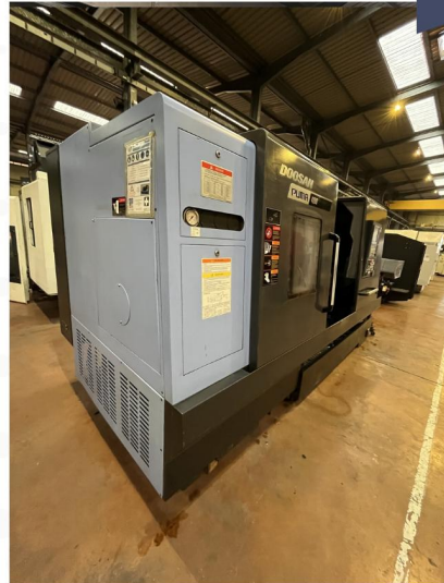
TOUR CNC DOOSAN TYPE 4100B (7).webp