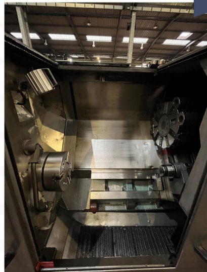
TOUR CNC DOOSAN TYPE 4100B (6).webp