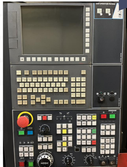
TOUR CNC DOOSAN TYPE 4100B (5).webp