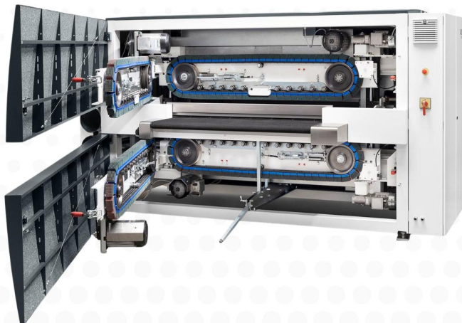
Image 5 - SBM - XL G2S2 - LISSMAC.webp