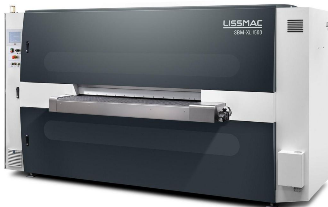
Image 3 - SBM - XL G2S2 - LISSMAC.webp