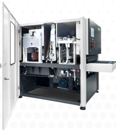
Image 5 - SMD - 133 DRE - LISSMAC.webp