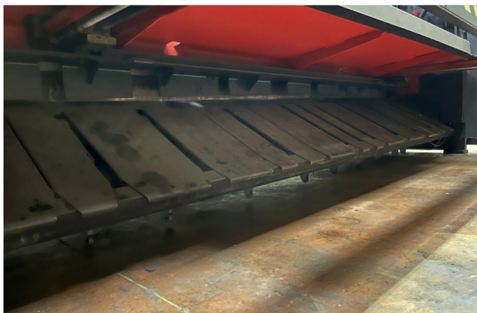
CISAILLE GUILLOTINE AMADA GX 840 GE (4).webp